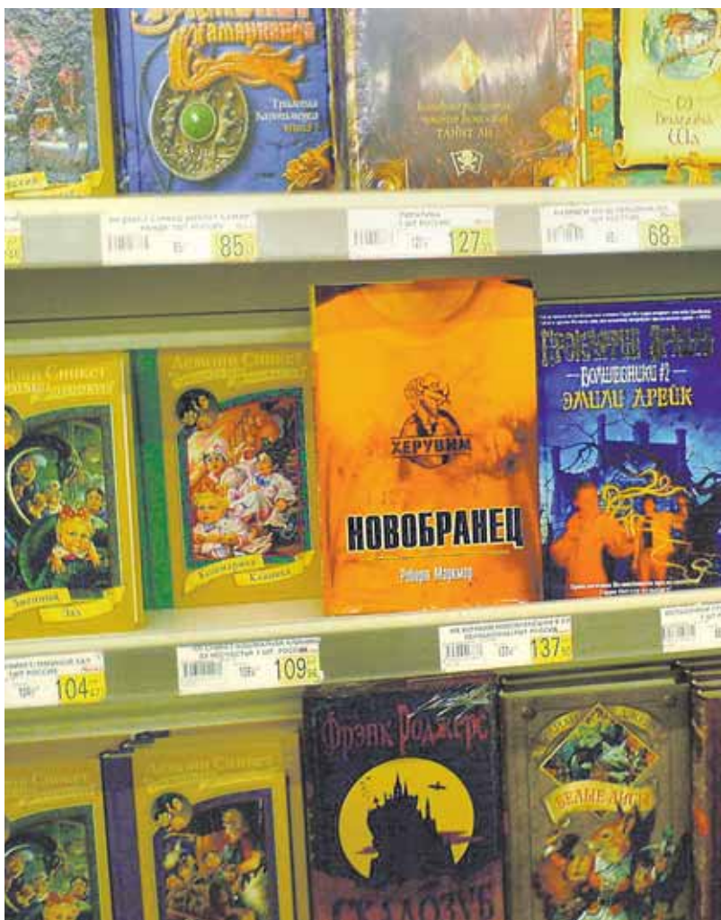
Как это ни парадоксально, даже на книжном прилавке можно купить некачественную подделку. При этом, в случае отравления, любой читатель-покупатель может обратиться в Роспотребнадзор