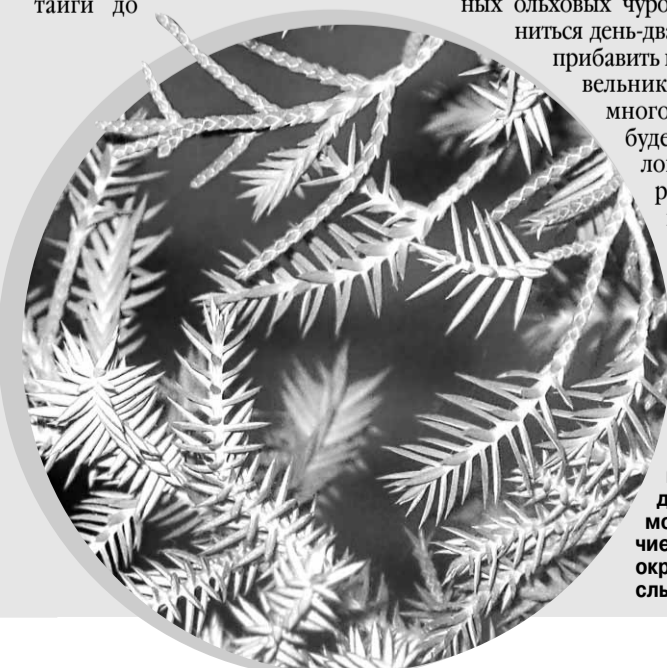
У китайского можжевельника два типа веток – молодые и колючие с голубоватым окрасом, и взрослые – чешуйчатые

Главное, что нужно обеспечить для зимовки любому субтропическому растению – баланс света и температуры. Чем прохладнее, тем ниже может быть освещенность, и наоборот. Один мой приятель-художник, например, взял себе за правило всякий раз, садясь за рабочий стол, переносить свой можжевельник под настольную лампу – и, честное слово, этот зимующий в условиях очень теплой комнаты экземпляр выглядит просто превосходно! Прочее – несложно: бедные, с добавлением крупного песка и хвойной земли грунты, внимательный полив – не пересушивать полностью, но и не заливать, редкие, раз в пару месяцев, подкормки комплексными минеральными удобрениями. Что же касается размножения, то из всех хвойных растений проще нашего сегодняшнего героя черенкуется разве что туя.