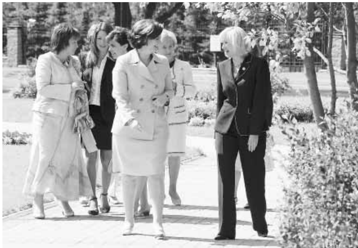
Пока высокие мужчины решали глобальные вопросы, их леди устроили веселый девичник

Вопрос энергетической безопасности стал практически основным. Если раньше под этим понимали бесперебойное снабжение энергоресурсами, то теперь считается, что энергобезопасность связана и с добычей, и с транспортировкой, и с продажей энергии.