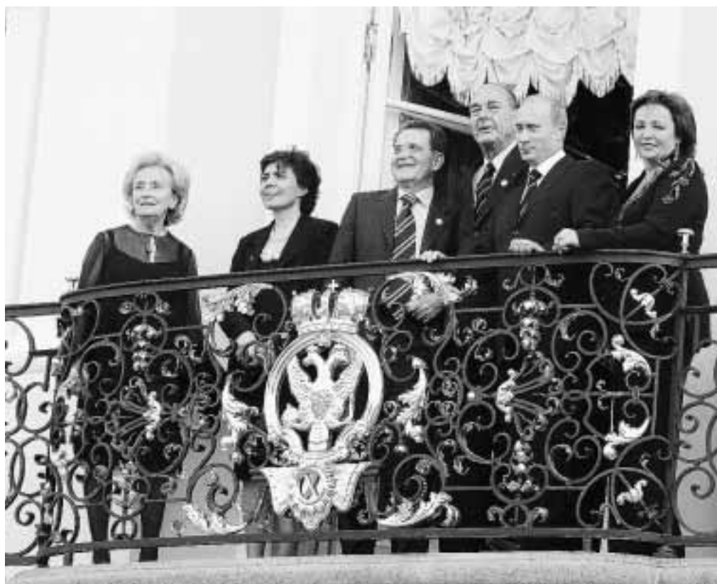
Стрельна поразила высоких гостей имперской роскошью и блеском

17 июля завершил работу саммит «Большой восьмерки». Впервые наша страна принимала у себя форум лидеров ведущих промышленно-развитых демократических стран, участниками которого являются Россия, США, Великобритания, Франция, Япония, Германия, Канада и Италия. Со временем политики подведут главные итоги форума. А вот о том, каким увидели саммит корреспонденты «НП», наш сегодняшний рассказ.